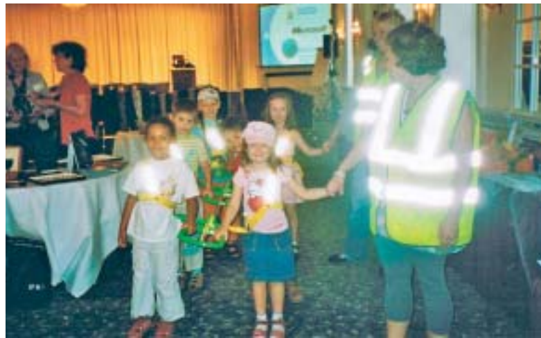
Lapsia esittelemässä Walkadile-telinettä.

Tietokonevetoisia hanke-konsepteja edustivat esim. seuraavat projektit: Englanninkielinen koulutuskeskus, jossa kieltä opiskellaan käyttämällä interaktiivista Power Point-ohjelmaa, "Villas for Travellers"-ohjelma matkatoimistoille ja yksin matkustaville (verkostoon kuuluu yhdeksän maata ja 600 kiinteistöä), Dhaka-hyväntekeväisyys-hanke,